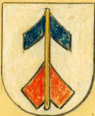
Hans Boeny Stadtkirche Winterthur

In gleicher Form und Tingierung ist es auch in den Monumenta Heraldica Helvetiae ( Sammlung schweizerischer Familienwappen der Schweiz. Heraldischen Gesellschaft in der Stadtbibliothek Winterthur) eingetragen. Es gilt somit offiziell als Familienwappen der Böni oder Böhny aus Amden.