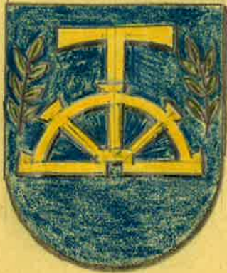
Böni (Böhny) Amden

Die Entstehung des Familiennamens Böni kann auf zweifache Art gedeutet werden: 1. kann er eine Kurzform des Vor- oder Taufnamens Bonifatius sein, wie sehr viele Familiennamen aus ursprünglichen Taufnahmen entstanden sind, 2. kann es sich beim Familiennamen Böni aber auch um eine Herkunftsbezeichnung handeln, ausgehend vom Weiler Bönigen bei Nidfurn ( Kt. Glarus), der auch dem Geschlechte Böniger den Namen gab. Dieses Geschlecht nannte sich ursprünglich "ab" oder " von Bönigen", laut Urkunde vom 29. Sept. 1350. Böni wäre somit eine abermalige Kurzform von Böniger. Der Weilername, und somit auch die genannten Familiennamen gehen auf die im westfränkischen und langobardischen bezeugte Kurzform vom wahrscheinlich lateinischen " Bonus" entstandenen " Bono" zurück. ( Die Namen der glarnerischen Gemeinden von Fritz Zopfli 1941)